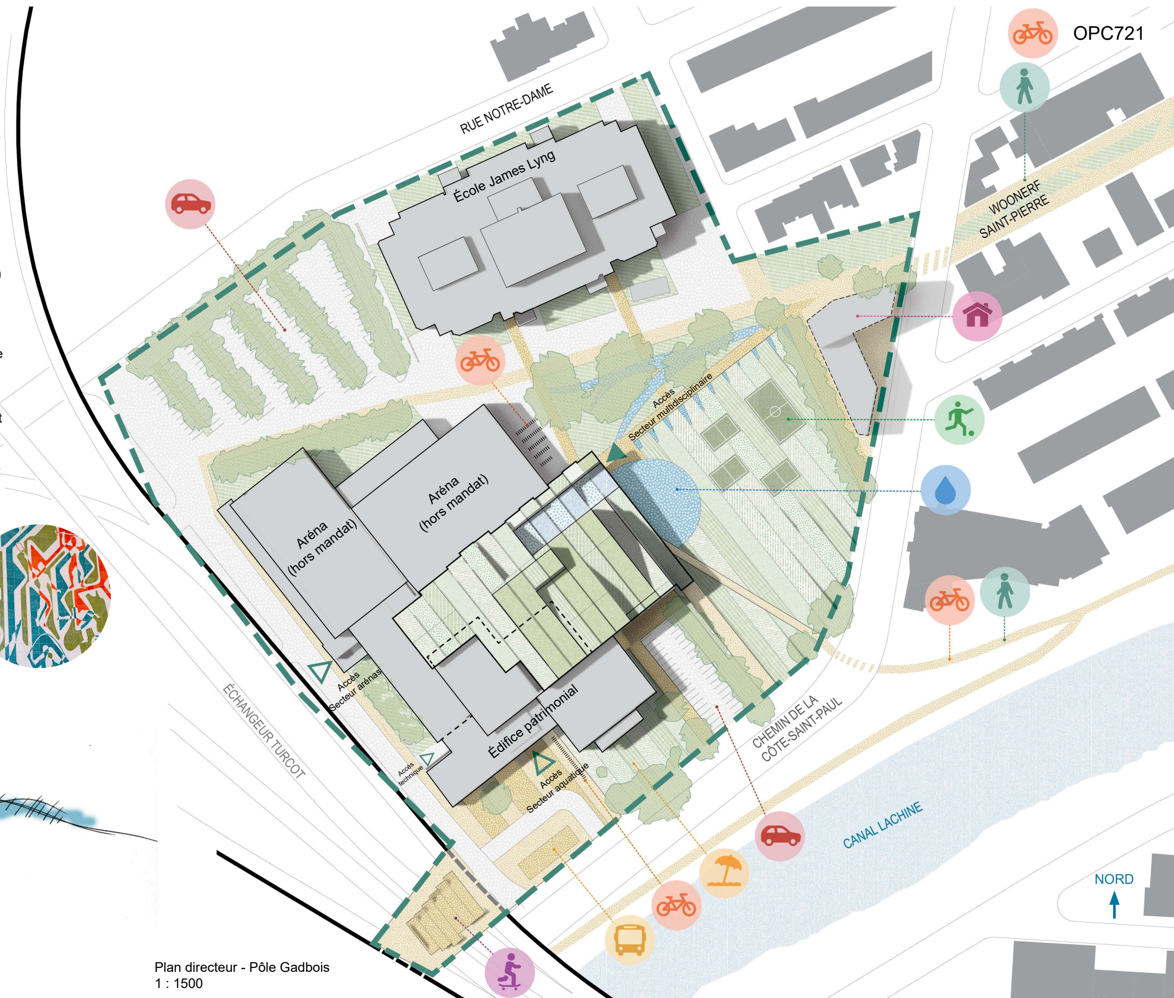
Plan directeur - Pôle Gadbois 1 : 1500