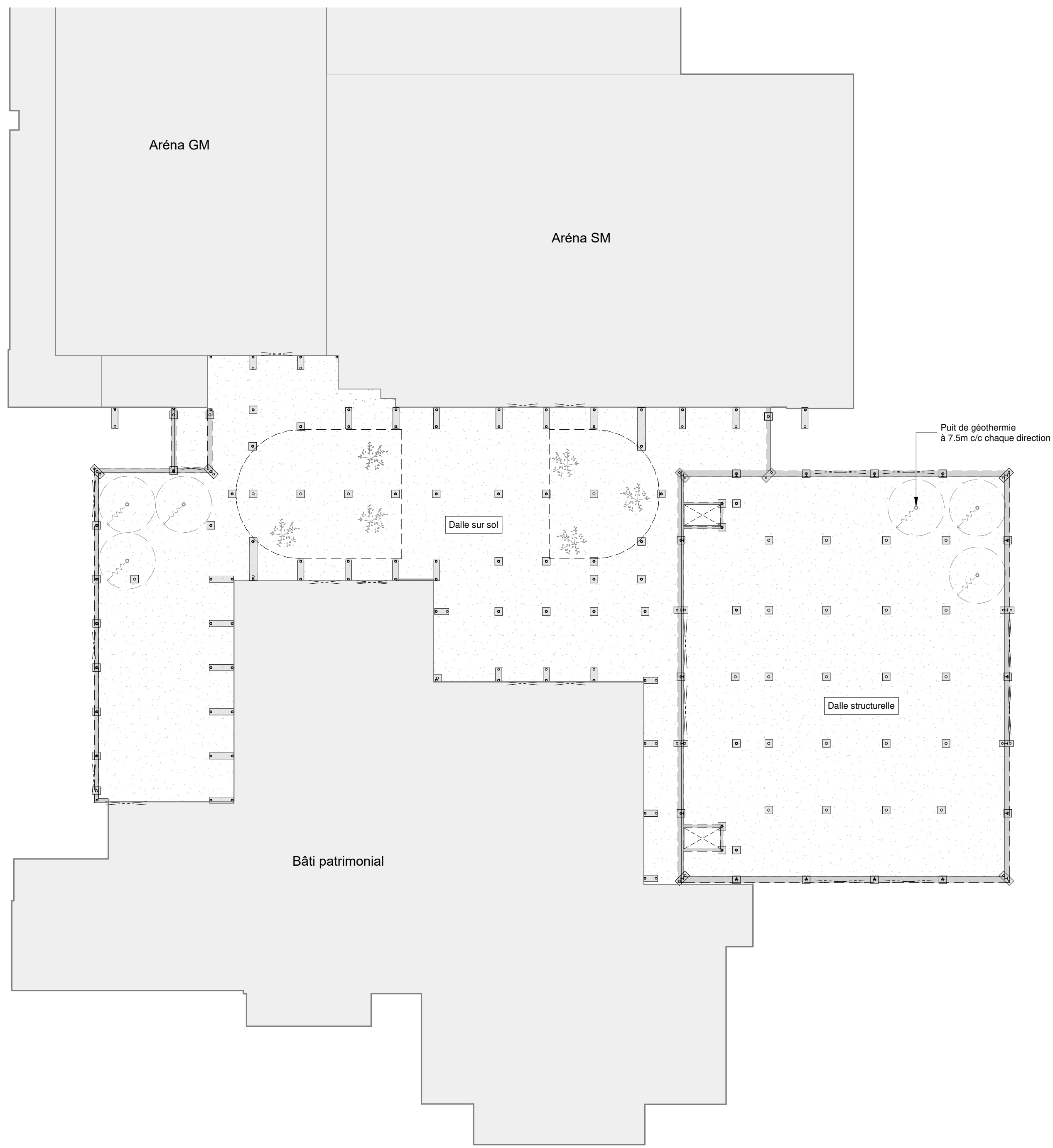
Plan de structure - Fondations échelle : 1 : 400