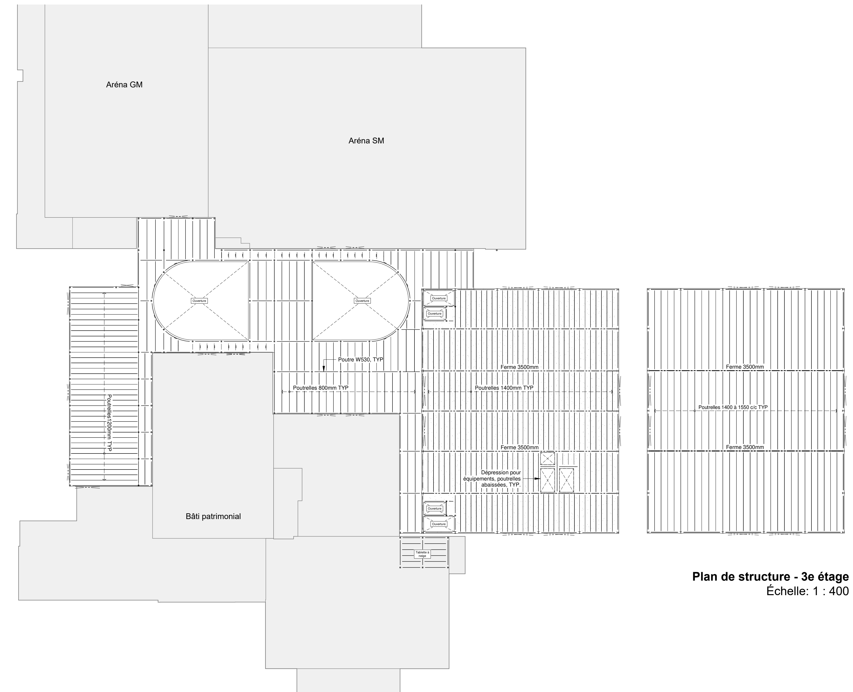
Plan de structure - 3e étage Échelle: 1 : 400