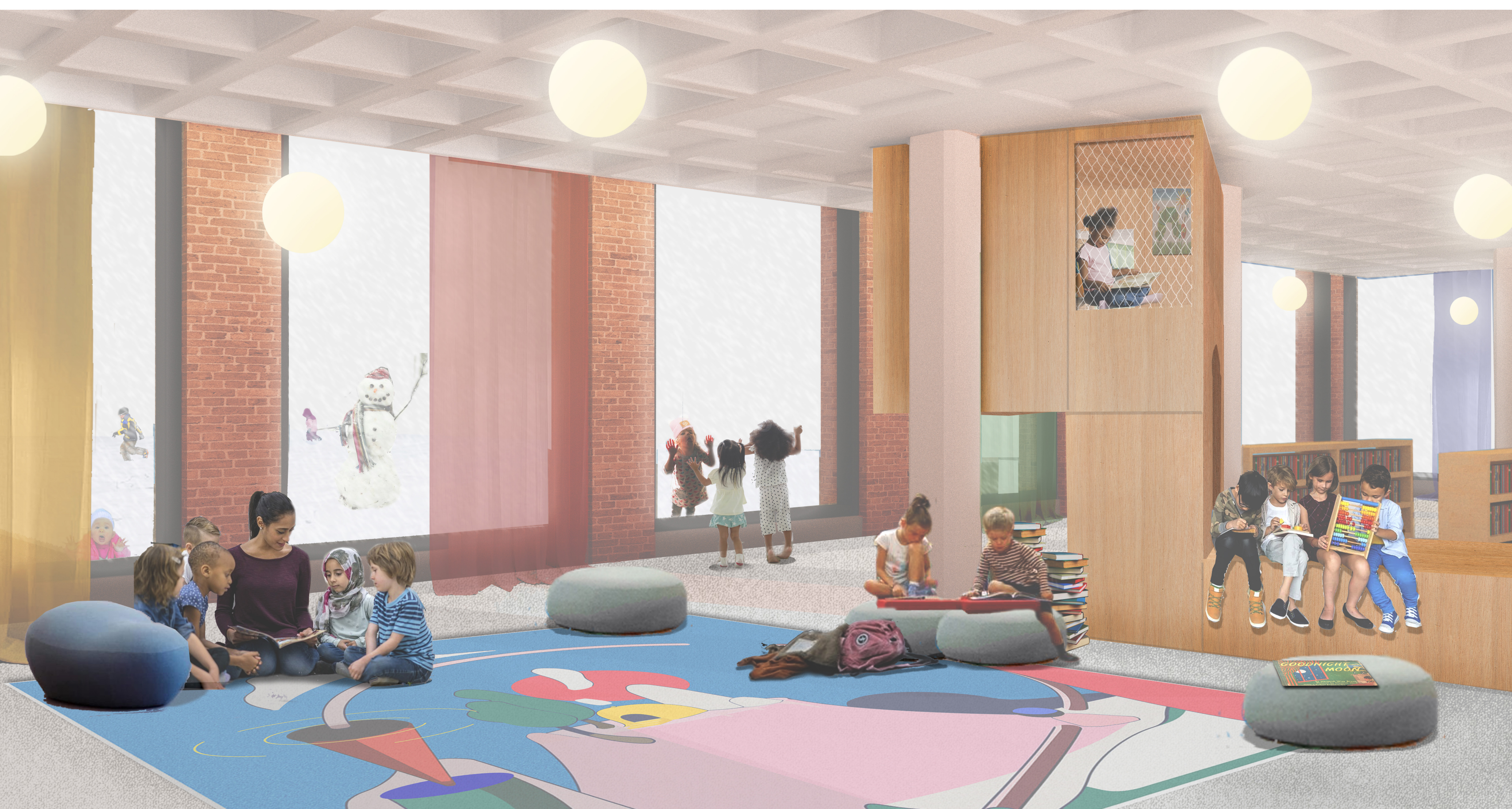
LA ZONE FAMILLE, ANIMÉE