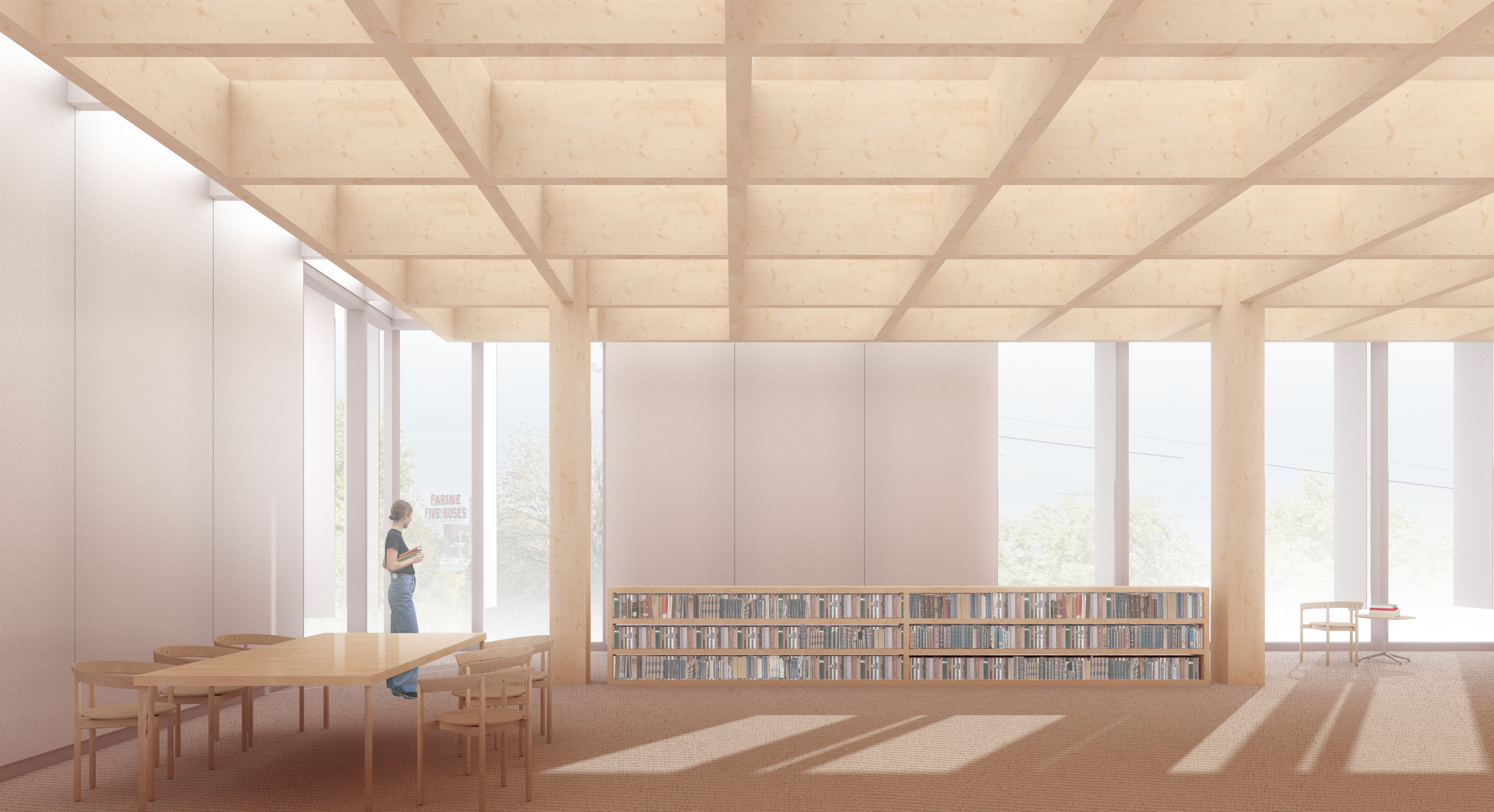
LES COLLECTIONS ADULTES, LIEU DE TRANQUILITÉ