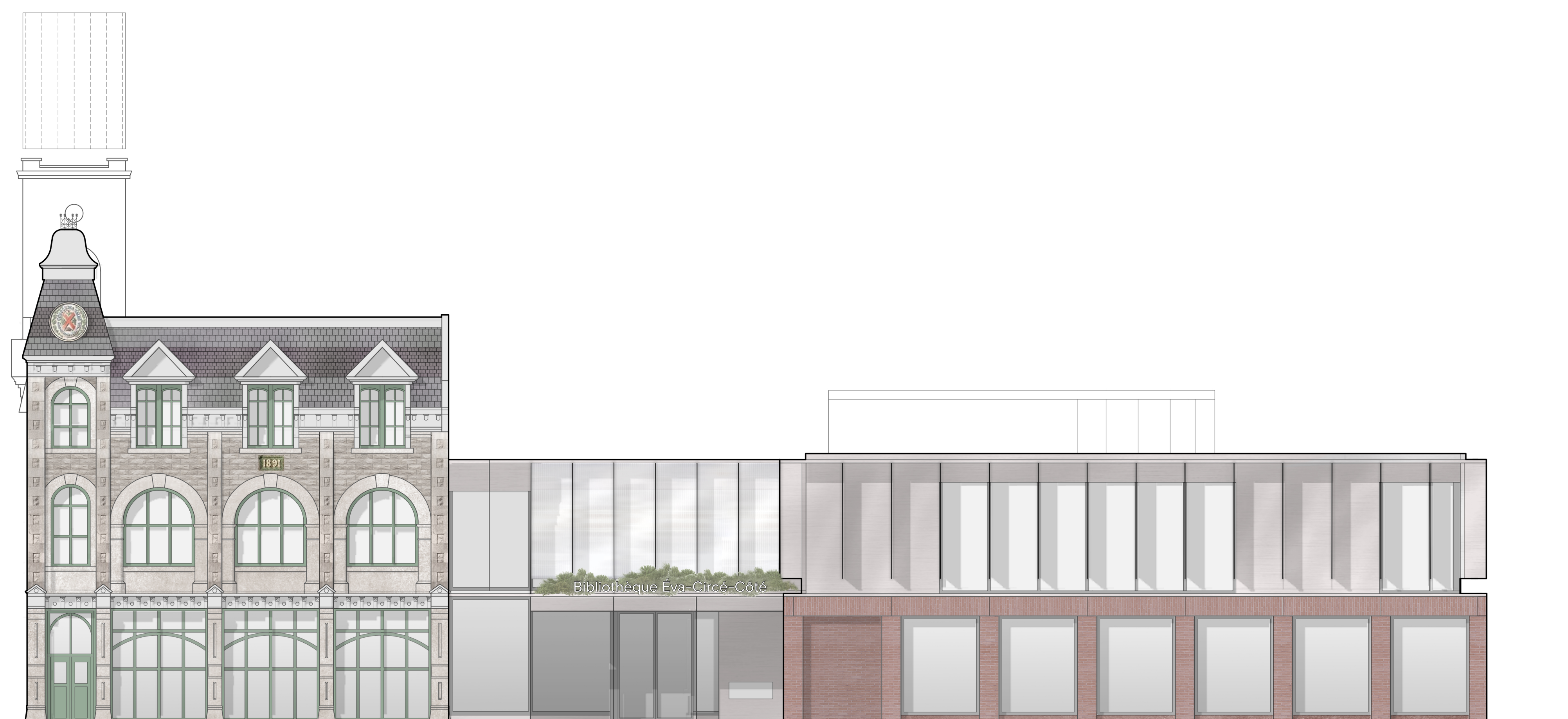
ÉLÉVATION RUE HIBERNIA | 1:100