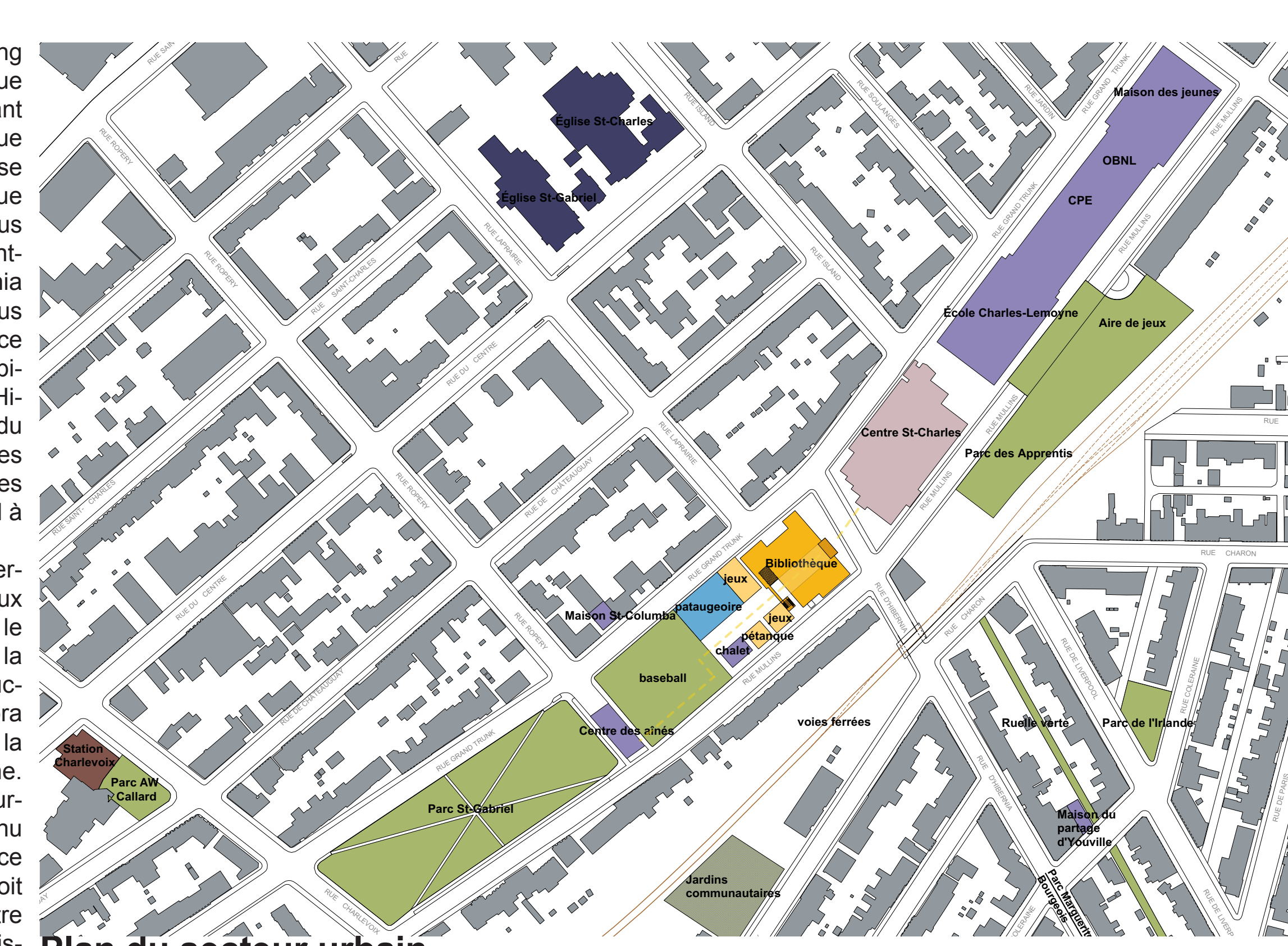
Plan du secteur urbain

Sur la rue d'Hibernia et sur la rue Grand Trunk, l'architecture de la nouvelle construction est très simple. Elle se distingue nettement de celle de l'ancienne caserne. La volumétrie, la matérialité et la couleur dominante des façades de l'addition reprennent celles des façades secondaires de la caserne. Elles mettent en valeur l'architecture de l'édifice ancien et plus particulièrement celle de sa façade monumentale en pierre grise. À la jonction des deux constructions, une marquise accueillante abrite la nouvelle entrée et en signale clairement la présence. Au-dessus de celles-ci, le recul de la nouvelle façade dégage le volume original de la caserne et crée un espace où sont suspendus des lettres formant les mots BIBLIOTHÈQUE ÉVA CIRCÉ CÔTÉ, la nouvelle bibliothèque est ouverte !