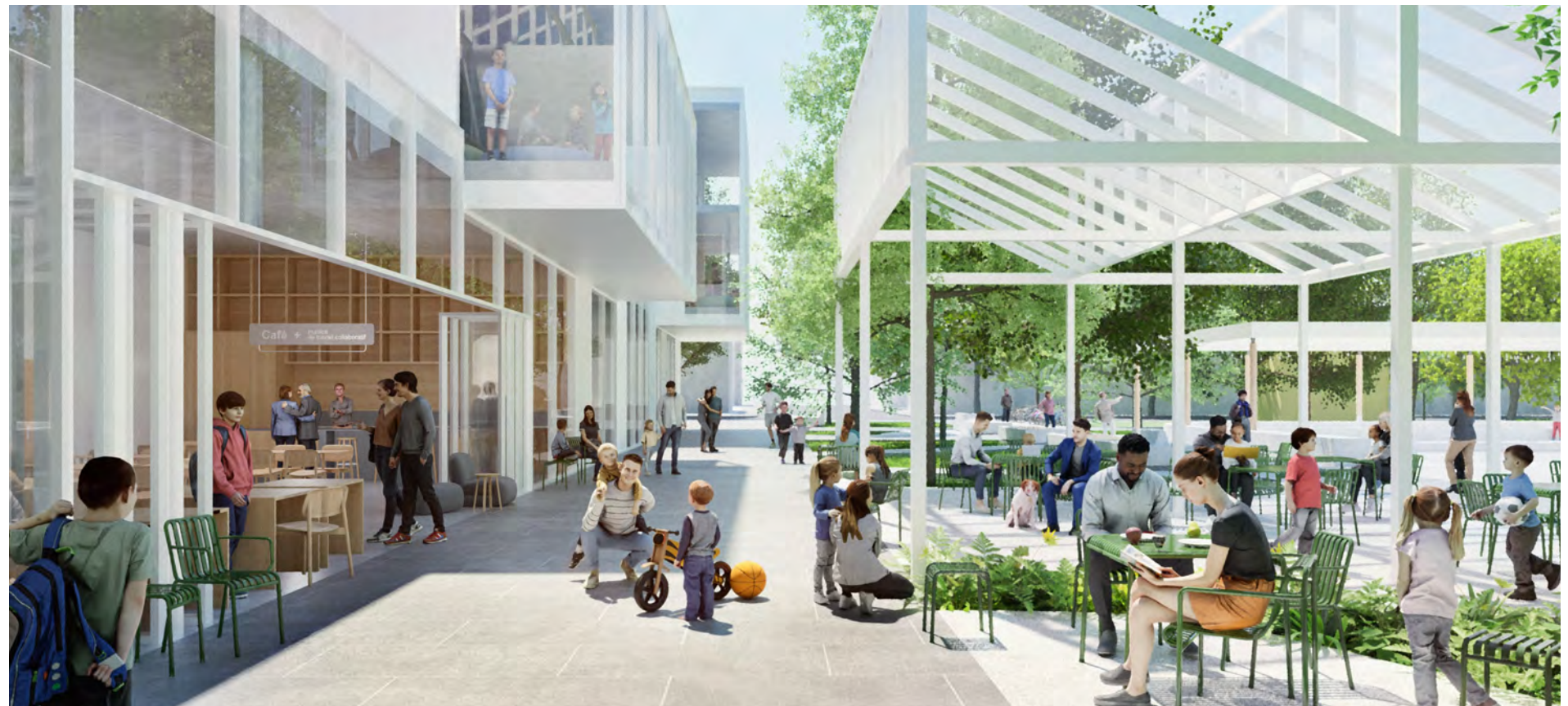
Café et terrasse sur l'allée Castelnau

La façade de la bibliothèque-jardin comporterait de larges ouvertures grâce à un système de portes pliantes en verre pour mettre en lien direct la terrasse avec le café et la zone de travail partagé. Le café pourrait profiter de la présence du jardin collectif pour son offre alimentaire et s'approvisionner également dans une petite serre de production avec bacs verticaux hydroponiques qui serait la pièce où se donne l'heure du conte et qui serait visible aussi à partir de l'étage supérieur. La toiture en dents de scie de cet étage permettrait un apport de lumière indirecte du nord dans le secteur des adultes et servir de support aux panneaux photovoltaïques orientés au sud.