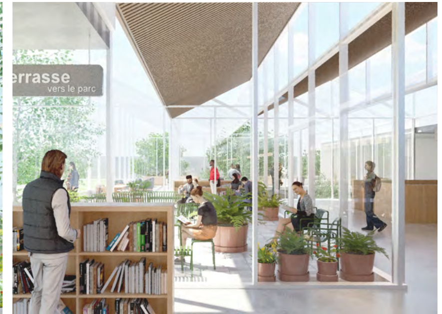
Esplanade des adultes et terrasse

La façade de la bibliothèque-jardin comporterait de larges ouvertures grâce à un système de portes pliantes en verre pour mettre en lien direct la terrasse avec le café et la zone de travail partagé. Le café pourrait profiter de la présence du jardin collectif pour son offre alimentaire et s'approvisionner également dans une petite serre de production avec bacs verticaux hydroponiques qui serait la pièce où se donne l'heure du conte et qui serait visible aussi à partir de l'étage supérieur. La toiture en dents de scie de cet étage permettrait un apport de lumière indirecte du nord dans le secteur des adultes et servir de support aux panneaux photovoltaïques orientés au sud.