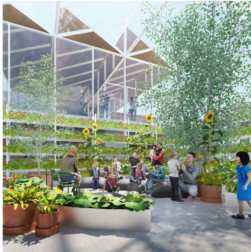
La serre et l'heure du conte