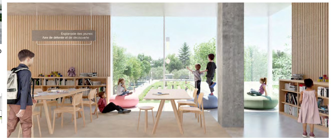
Espace de lecture et vue vers le parc