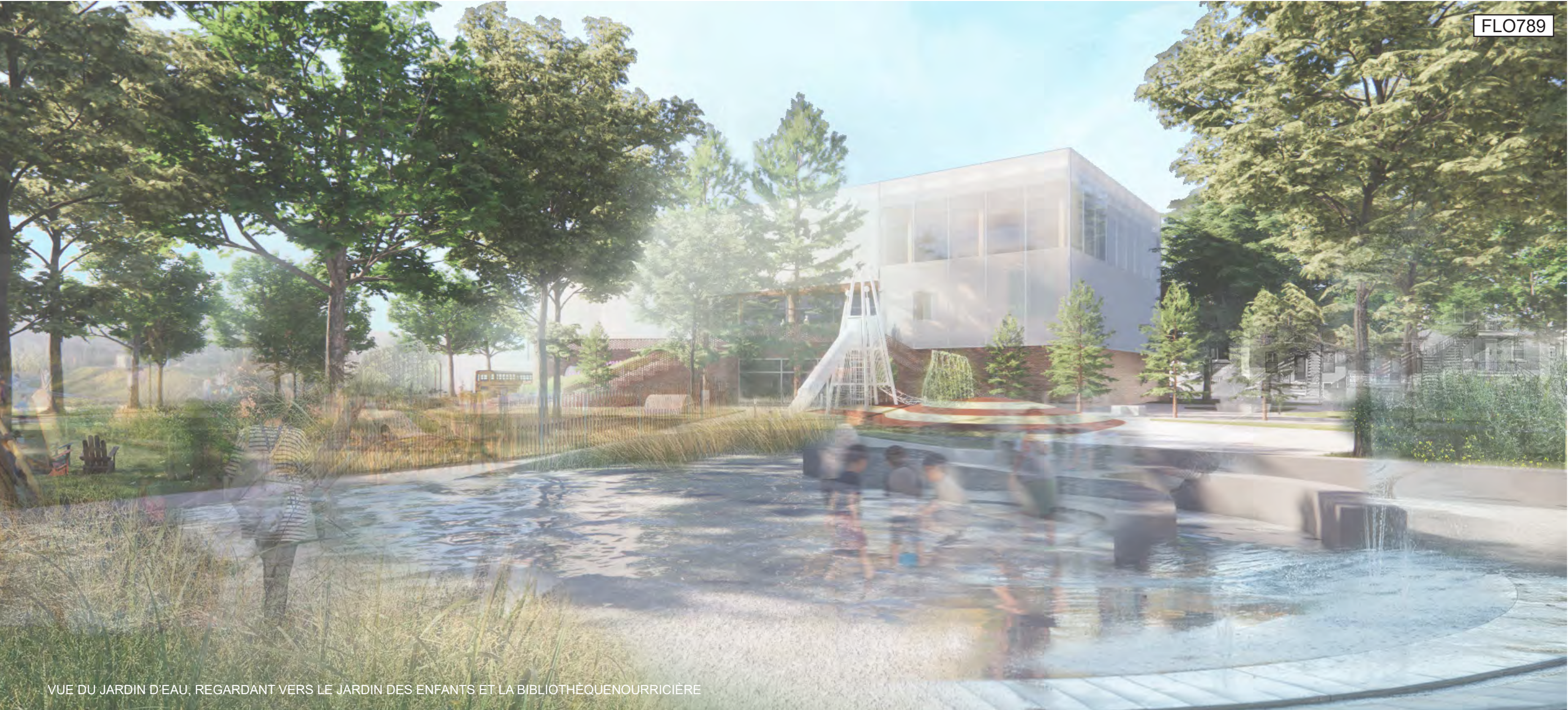
VUE DU JARDIN D'EAU, REGARDANT VERS LE JARDIN DES ENFANTS ET LA BIBLIOTHÈQUE NOURRICIÈRE