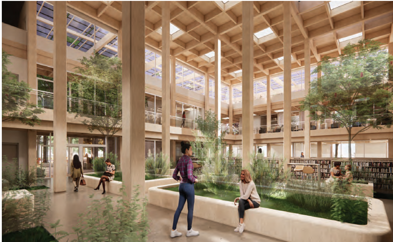
LE COEUR DE LA CANOPÉE