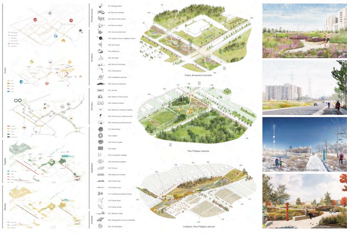
Table Architecture | LAND Italia | civilti | Biodiversité Conseil