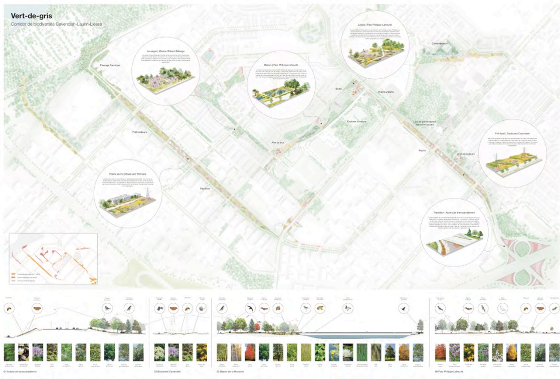
Table Architecture | LAND Italia | civilti | Biodiversité Conseil